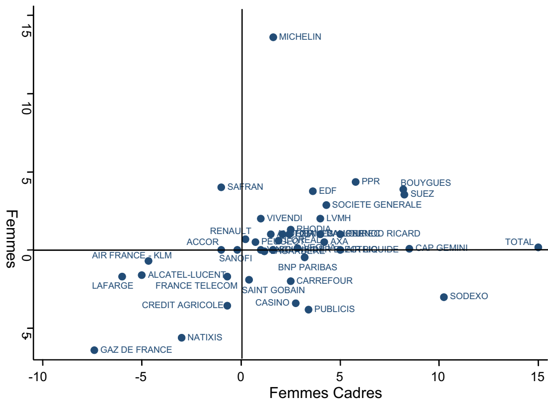
Tableau 2 - Pourcentages d'évolution de la part des femmes dans l'effectif et dans l'encadrement entre 2007 et 2010

Le fait que les entreprises les plus féminisées enregistrent une augmentation des pourcentages de femmes et de femmes cadres alors que les entreprises les moins féminisées se caractérisent par une stagnation, voire une baisse du pourcentage de femmes, contribue à accentuer la bipolarisation sexuelle des grandes entreprises.